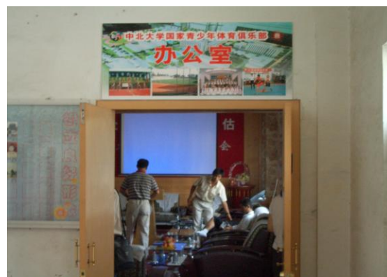
体育俱乐部办公室