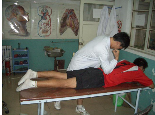
运动队医务人员对运动员进行训练后的按摩恢复