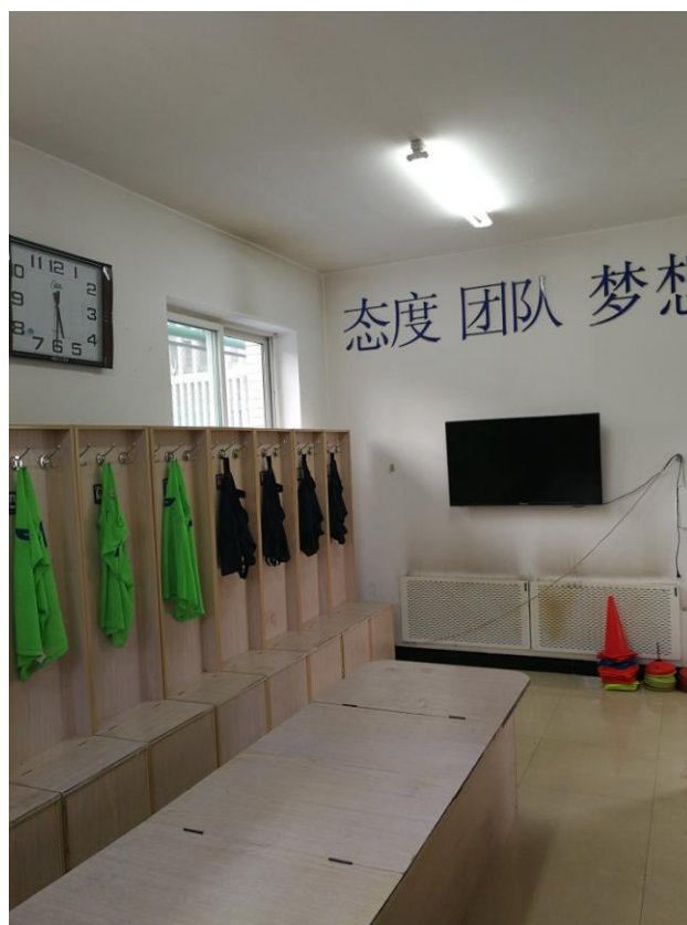
足球代表队更衣室