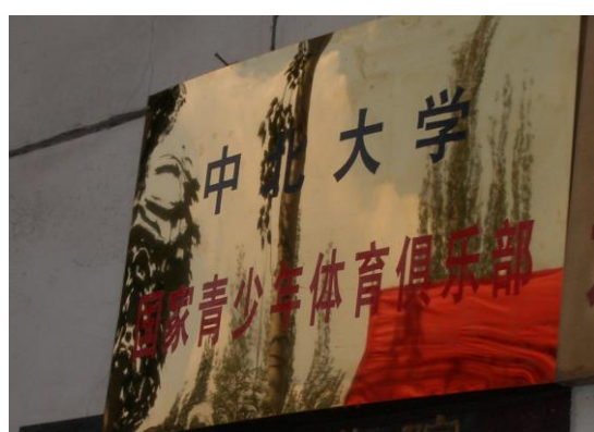
国家青少年俱乐部