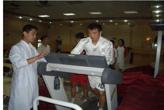
利用意大利 TECHNOGYM 跑台采取数据