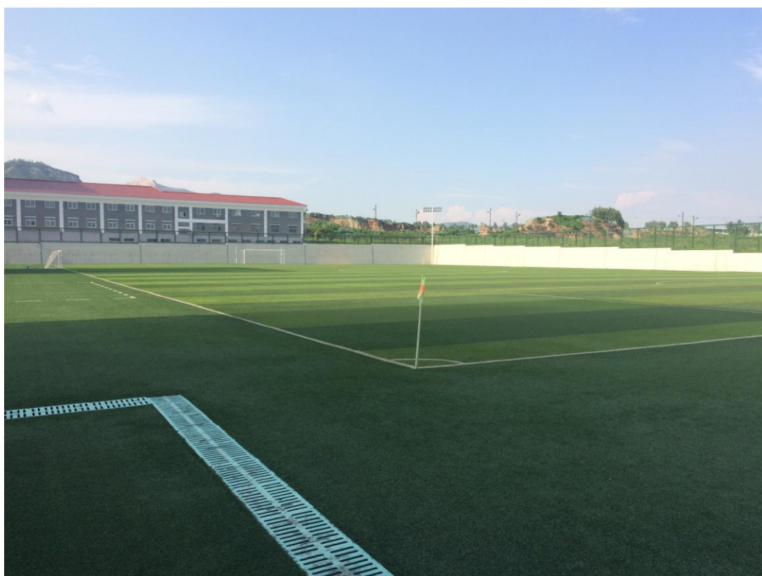
足球队专用训练场